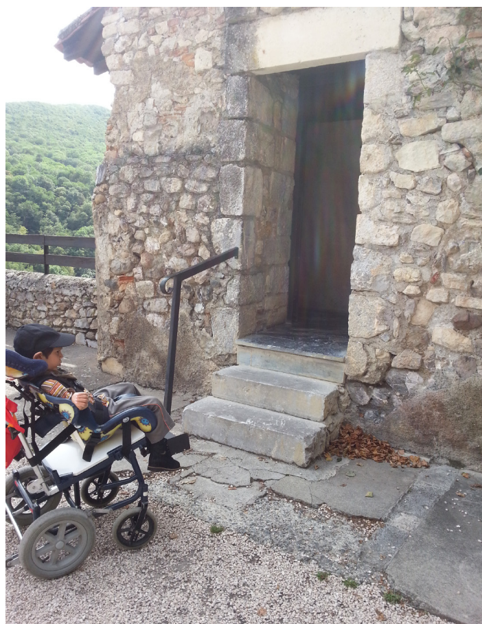
Accessibilité, une vaste plaisanterie...