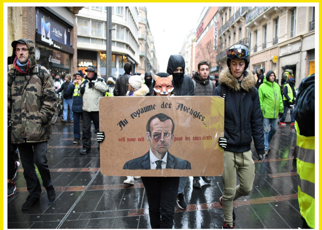
Toulouse le 2 février