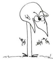
Article rédigé par Shadok

Nous demandons au gouvernement de bien prendre en compte ce « changement de cap ». Nous demandons également à toutes les mairies de faciliter la tenue de ces assemblées populaires en mettant à disposition de tous les participants les salles et équipements pour leur bon déroulement.